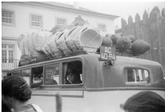
A Feira de Ponte © Conde d'Aurora

28 junho – Avenida dos Plátanos (Org. P. L. Arte)