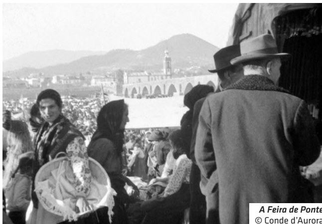
A Feira de Ponte

27 novembro – Avenida dos Plátanos (Org. P. L. Arte)