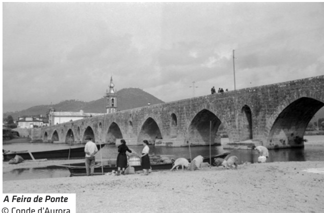
A Feira de Ponte

24 abril – Avenida dos Plátanos (Org. P. L. Arte)