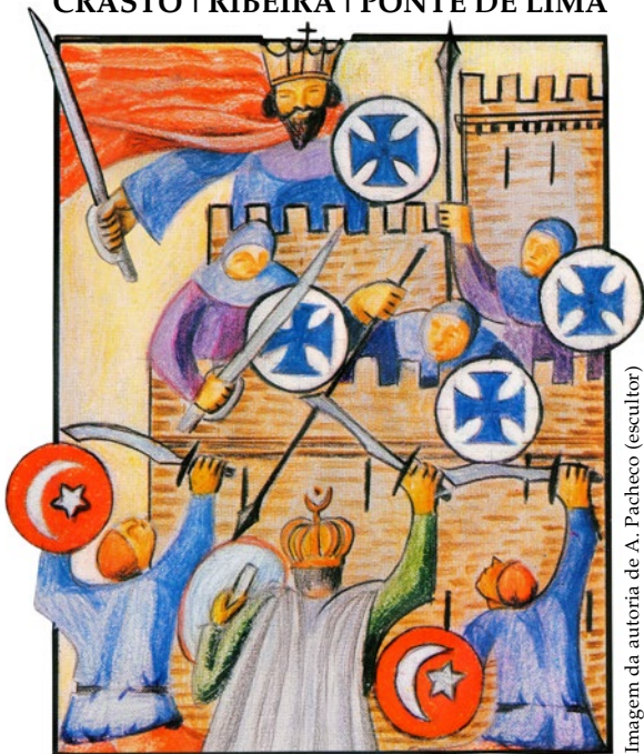
Imagem da autoria de A. Pacheco (escultor) para a Obra TURQUIA - TEATRO POPULAR de João Rodrigues de Sousa