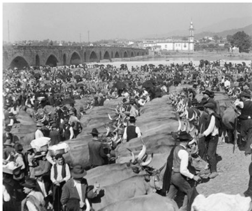
A Feira de Ponte

28 agosto – Avenida dos Plátanos (Org. P. L. Arte)