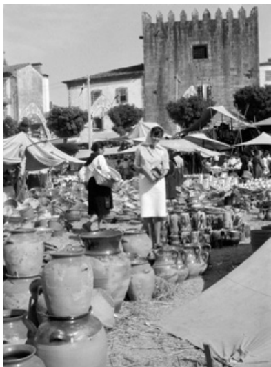
A Feira de Ponte

22 janeiro – Avenida dos Plátanos (Org. P. L. Arte)