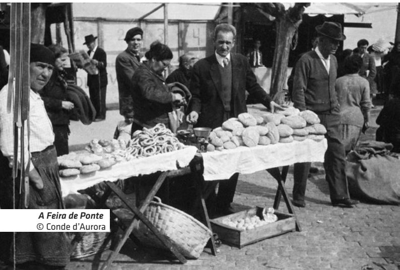
A Feira de Ponte © Conde d'Aurora

25 novembro – Avenida dos Plátanos (Org. P. L. Arte)