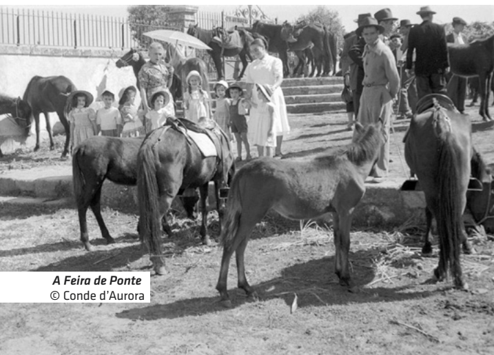
A Feira de Ponte

28 outubro – Avenida dos Plátanos (Org. P. L. Arte)