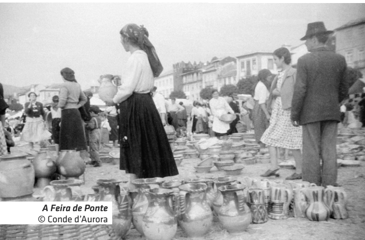
A Feira de Ponte © Conde d'Aurora

28 janeiro – Avenida dos Plátanos (Org. P. L. Arte)