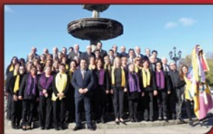
ORFEÃO LIMIANO PONTE DE LIMA