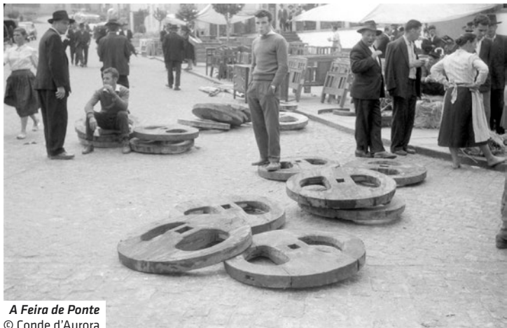
A Feira de Ponte

17 dezembro – Avenida dos Plátanos (Org. P. L. Arte)