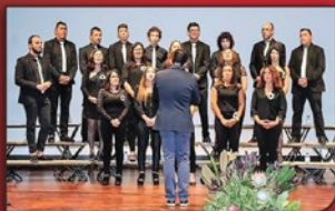
CORAL CAETANENSE CANTANHEDE

17 DE DEZEMBRO DE 2017 | 15H30 IGREJA MATRIZ DE PONTE DE LIMA