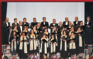
GRUPO CORAL DE OIÃ OLIVEIRA DO BAIRRO