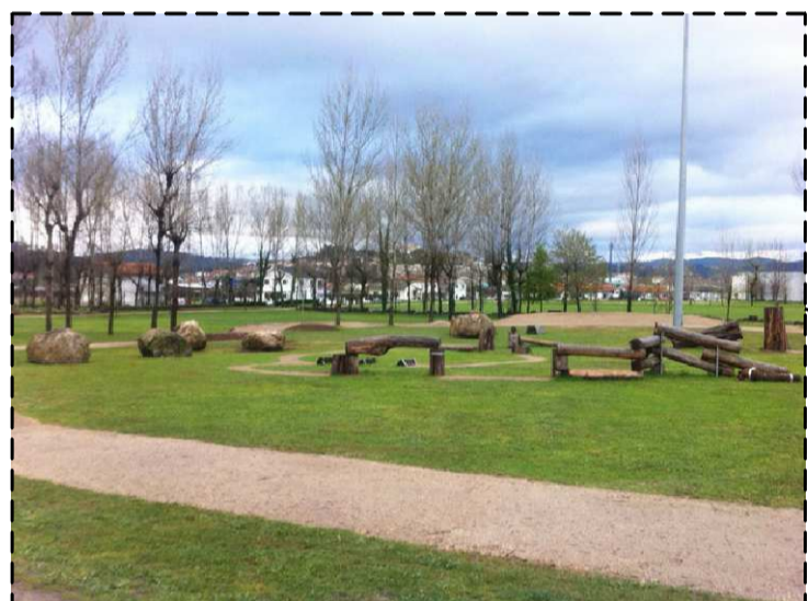
PISTA DE TRIAL BIKE