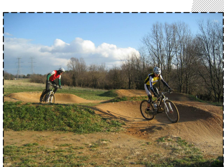
PISTA DE PUMP TRACK