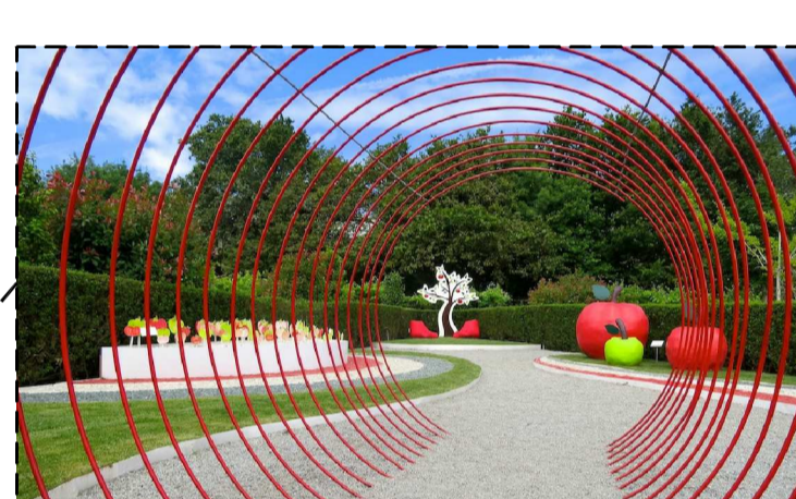
MOMENTOS COM ELEMENTOS DO FESTIVAL DE JARDINS