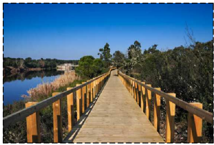
PASSADÇOS EM MADEIRA