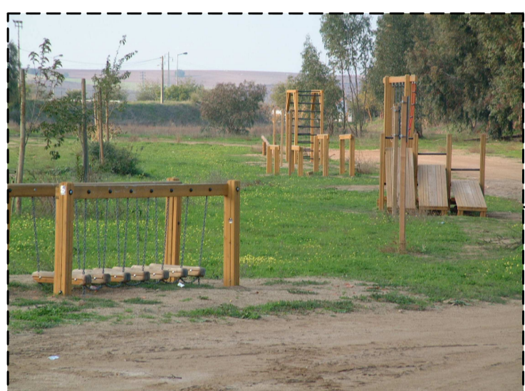
EQUIPAMENTOS DE MANUTENÇÃO FÍSICA