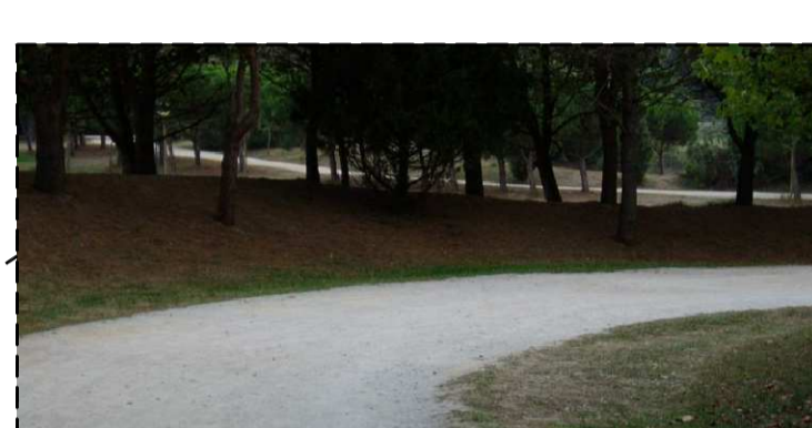
PERCURSOS ACESSÍVEIS E PERMEÁVEIS