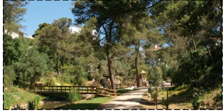
PASSADÇOS EM MADEIRA