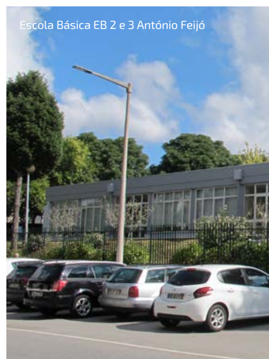
Escola Básica EB 2 e 3 António Feijó

pintadas as paredes interiores e exteriores e, em alguns casos, os pavimentos das salas de aulas foram substituídos. No total, estas obras significaram um investimento de rondou 1,5 milhões de euros, tendo sido, após a construção das respetivas escolas, o maior investimento no que à requalificação das infraestruturas diz respeito, nos últimos 30 anos. Desta forma, o concelho de Ponte de Lima tem todo o parque escolar devidamente requalificado, desde o pré-escolar até ao ensino secundário, o que representou, na globalidade, um investimento na ordem dos 40 milhões de euros.