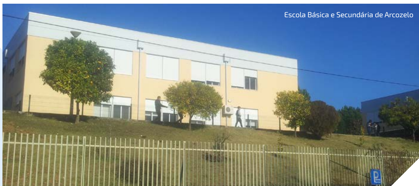
Escola Básica e Secundária de Arcozelo