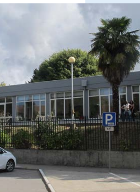
Escola Básica EB 2 e 3 de Freixo