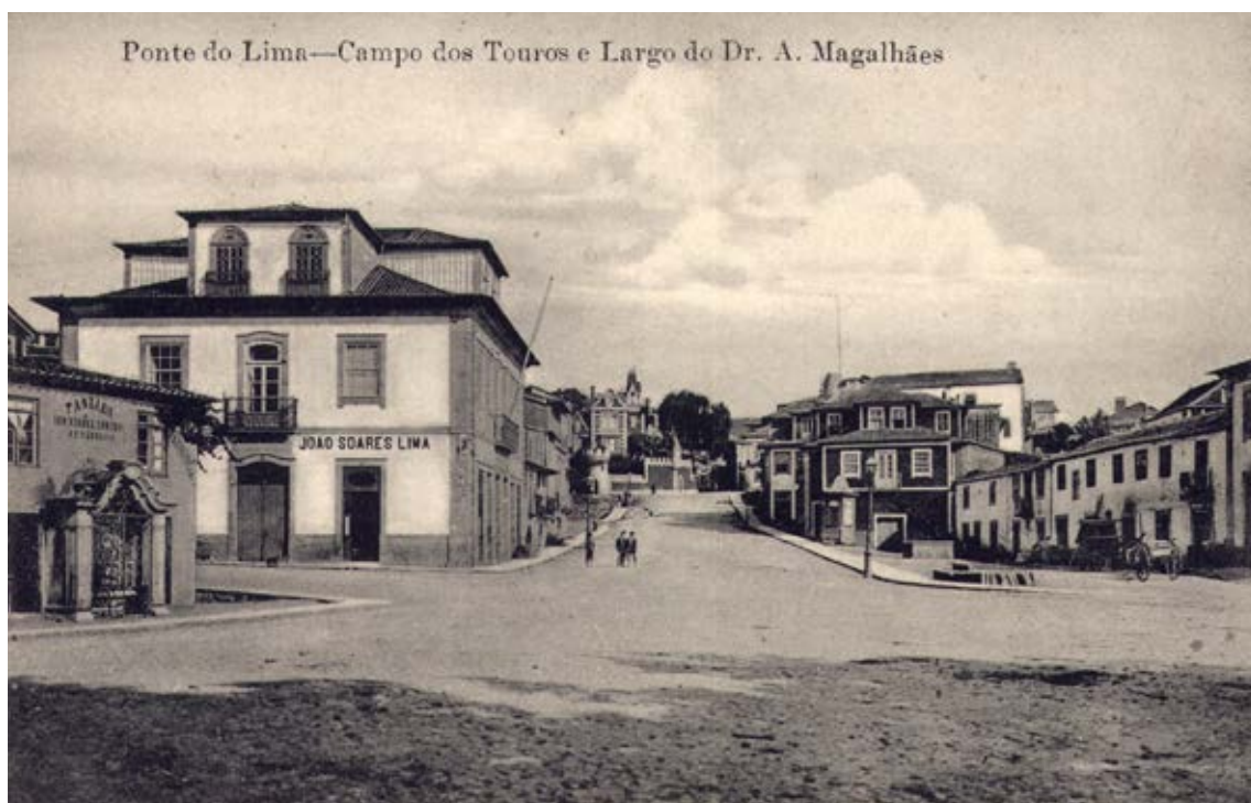
Ponte do Lima—Campo dos Touros e Largo do Dr. A. Magalhães