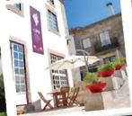
CIPVV Centro de Interpretação e Promoção do Vinho Verde