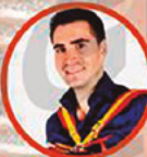
Borguinha de Braga