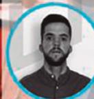
Pedro de Pitões