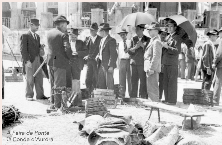
A Feira de Ponte © Conde d'Aurora