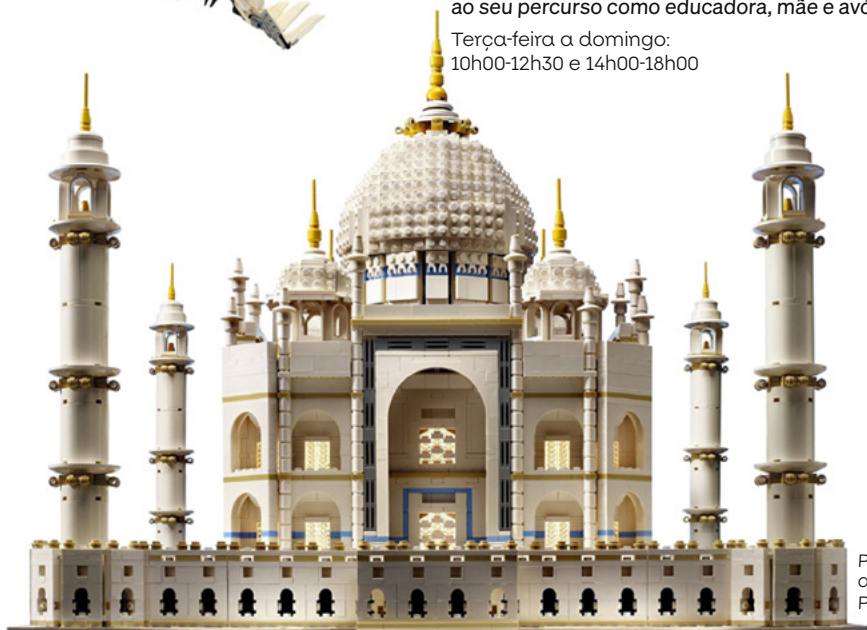
Peça a Peça